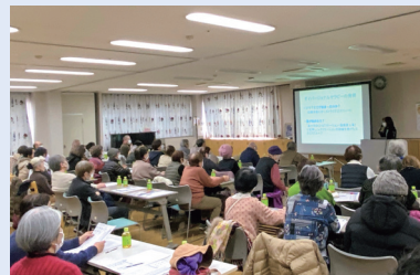
赤とんぼ講話(ケアセンター赤とんぼ)