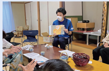
長嶺6町内いきいきサロン