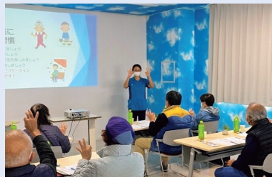
赤とんぼ講話(赤とんぼ大津)

地域に根ざした施設を目指して、「健康講座」や「介護教室」の開催、近所の老人会やいきいきサロンへの出前講座、地域で認知症の方をサポートする体制づくりにも積極的に取り組んでおります。医療についても、地域の方々を対象に、腎臓病や糖尿病をテーマに勉強会を開催しております。これからも地域の皆様の人生がいつまでも元気で楽しく明るいものとなるようお手伝いをしていきます。