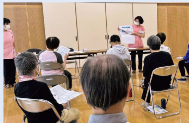
白川地域コミュニティセンター・ ハッピーサロンへ、CKD教室